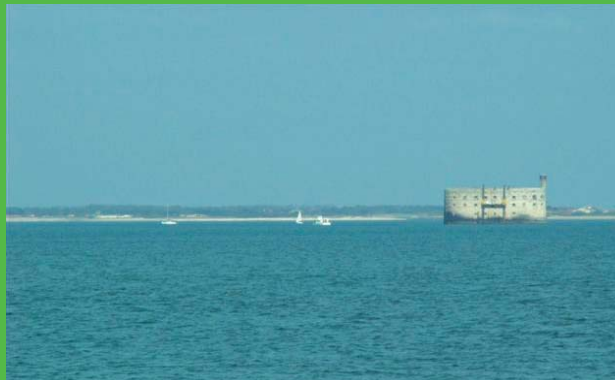
Pointe des Saumonards

André GENDRON 110 rue des Gitonnelles Sauzelle 17190 ST GEORGES D'OLÉRON ☎ 05 46 47 15 22